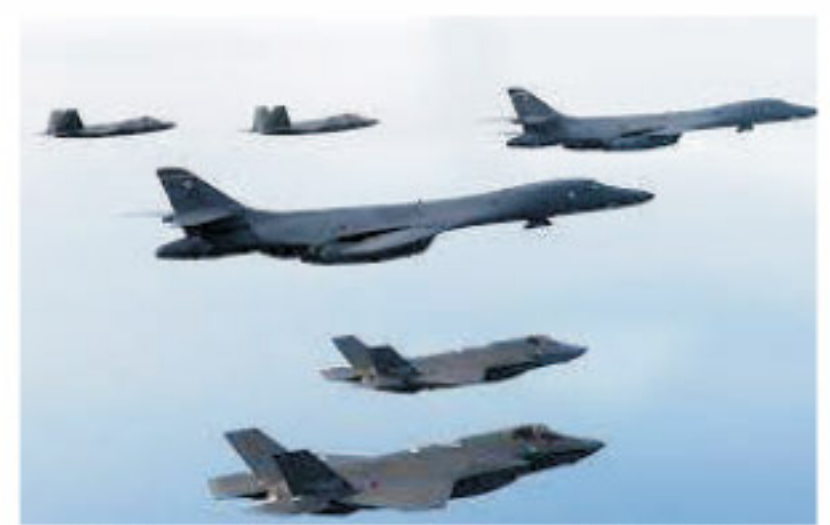
شمالی کوریا کا ہوا کا ہتھیار ہے۔ بین البراعظمی بیلسٹک میزائل کا تجربہ کیا ہے جو اس ہفتے شروع ہونے والی امریکہ اور جنوبی کوریا کی فوجی مشقوں کے ردعمل کے طور پر تھا۔ سرکاری میڈیا نے تصاویر جاری کیں جن میں شمالی کوریا کے رہنما کم جونگ ان، اپنی بیٹی کے ساتھ، لائچنگ کی کارروائی کو دیکھ رہے ہیں۔ اسے Hwasong-17 ICBM کا نام دیا گیا ہے۔ سرکاری کورین سینٹرل نیوز ایجنسی کے مطابق شمالی کوریا کا کہنا ہے کہ "امریکہ اور جنوبی کوریا کے کٹھ پتلی ننداروں کی بڑے پیمانے پر اشتعال انگیز اور جارحانہ جنگی مشقوں" کے جواب میں "لاچنگ ڈرل" کی گئی ہے۔ شمالی کوریا کے سرکاری نام کا مخفی استعمال کرتے ہوئے کہا گیا کہ "ہم انہیں اپنی مرضی سے یہ احساس دلائیں گے کہ DPRK کے خلاف ان کی فوجی مشقیں جتنی دیر تک مزید پھیلیں گی، ان کے لیے ناقابل تلافی خطرہ دستاویز سنگین ہوتا جائے گا۔"