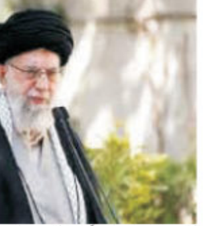
کی مدد کرنے پر آمادگی ظاہر کی۔ اس کی چابھی میں دونوں ملکوں میں معاہدہ سات پر حملوں کا الزام لگایا تھا جس کی وجہ سے کچھ روز کے لیے اس کی آدھی سپلائی ختم ہو گئی تھی۔ ایران نے اس میں