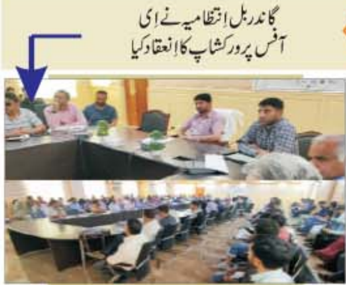
گاندھربل انتظامیہ نے ای آفس پر وکٹوریٹ کا انعقاد کیا